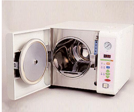
歯科用・高圧蒸気滅菌器 (オートクレーブ)