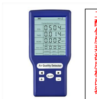
二酸化炭素濃度検出器