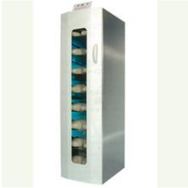
抗菌スリッパ滅菌装置