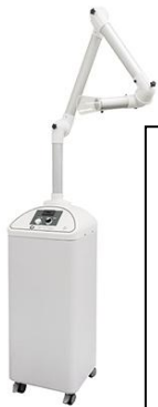
口腔外バキューム