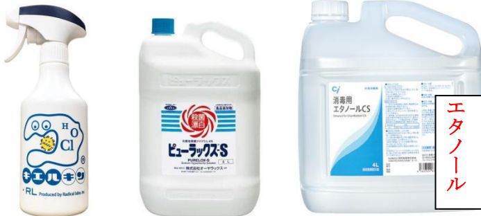
次亜塩素酸水溶液・ナトリウム