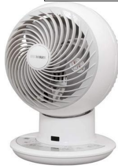
サーキュレーター