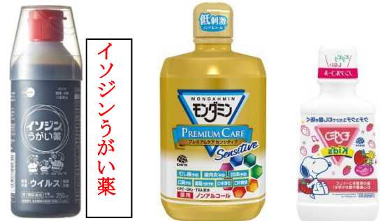
イソジンうがい薬